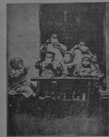
Curiosa escena china, en que siete rapaces de ojos oblicuos y trenza naciente, se ocupan en vaciar sus tazas de arroz, gloriando pero correctamente, según la costumbre de su país, manejando los tradicionales palillos, mientras un gallo familiar separa pacientemente que un movimiento generoso le permita participar de aquel festín.

de los ejércitos alemanes, austríacos y húngaros en Polonia. Al tener el honor de informar a ustedes esto, me permito agregar la siguiente explicación: Alemania relaciona especialmente con estas victorias la esperanza de que la conclusión de la paz tendrá lugar más pronto. Deseo recordar a ustedes, al mismo tiempo, que todas las declaraciones públicas del Emperador hechas hasta el 31 de Julio han proclamado que Alemania lucha por la paz, que obtendrá para sí y para las naciones que a su lado toman parte en esta resolución guerra con el fin de obtener las garantías absolutamente necesarias para asegurar la paz y el futuro de la nación más allá de las fronteras alemanas. La paz que sea capaz de conseguir dará a todos los pueblos la libertad de los padres y abrirá para todos los países la posibilidad de cooperar al avance de la civilización mediante la libre cooperación.